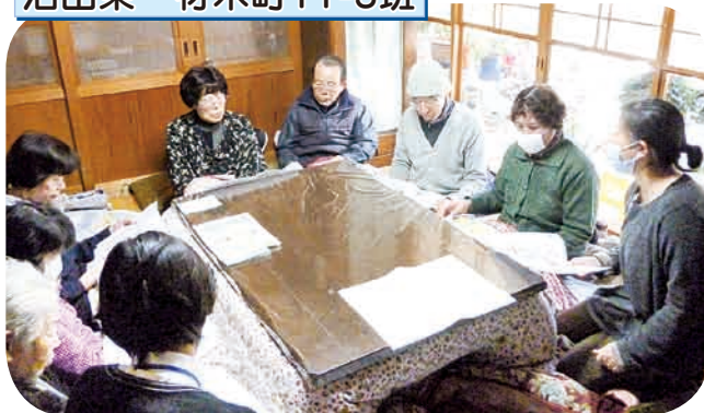
栄養士から減塩料理を学習。尿中測定も実施、塩分摂取量をチェックしました。