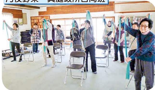
セラバンド体操・北国の春体操を中心に実施。ちょっとつかれたかな。来年度の予定もたてました。