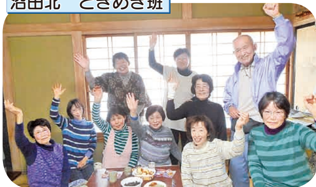
昨年の11月から班会が開けるようになりました。今回は「かるた大会」。次回の計画も楽しみです。