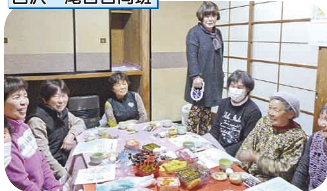
薬剤師から薬の話を聞き、アレルギーや薬の飲み方、残薬の調整など詳しく知りました。