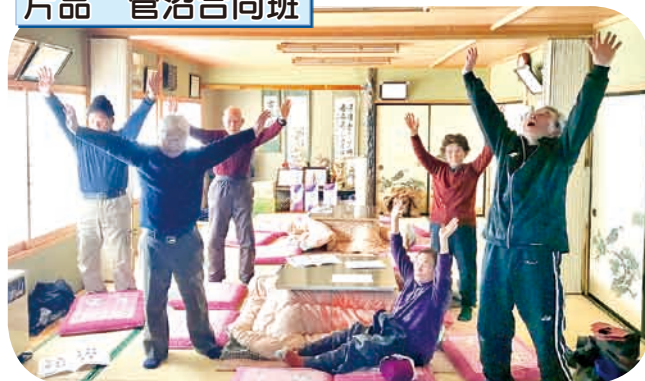
今回は笑いヨガ。笑うことで認知症を防げるのかな？