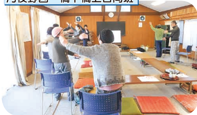
足指力を測定し、転倒予防体操を行いました。ころんで動けなくなると認知症になるもんね。