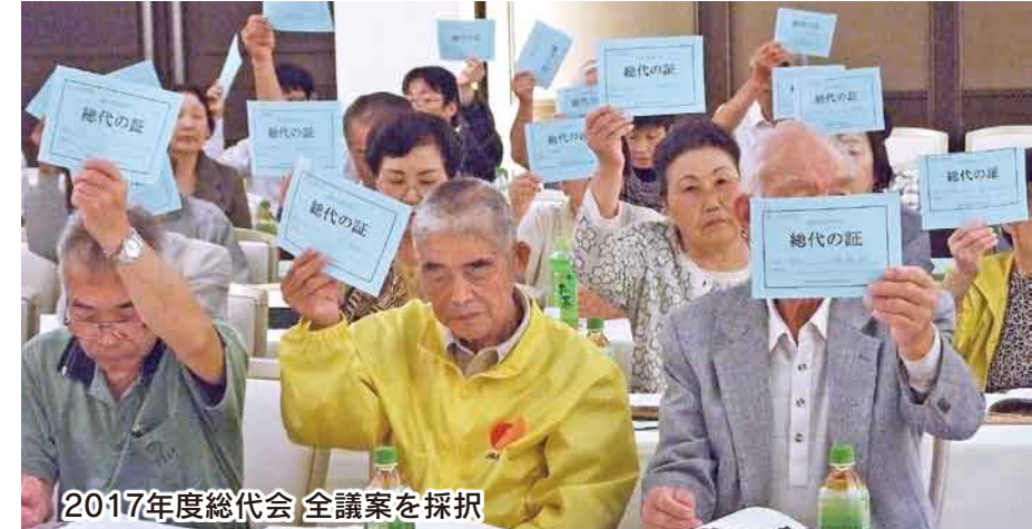
2017年度総代会 全議案を採択

ホームページ 利根保健 で検索できます http://www.tonehoken.or.jp/tonehoken-kumiai/