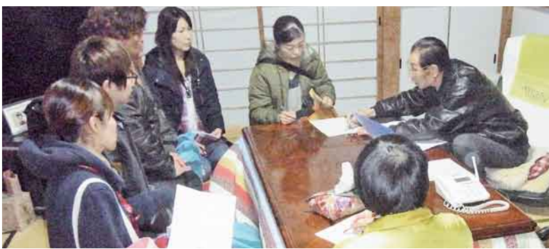
月夜野東支部・下牧地域の活動

夜野東支部では14日夜、残された下牧地域を班長と職員で5組に分かれて訪問。事前に訪問チラシを配布したことで出資金を準備して待つことができました。利根北支部は23日、昨年に引き続き支部主催のグラウンド・ゴルフ大会を開催。参加者に健康チ