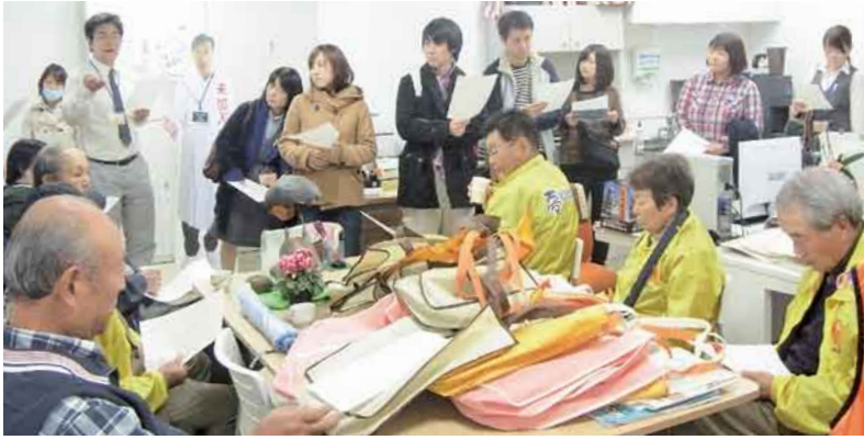
利南支部・集中訪問事前打ち合わせ

12日午後、南部ブロックの理事と正副支部長、連携職場を中心とした病院職員が、周辺の沼須町・上沼須町・新町の一部地域を一齐に訪問。移動して一年、病院の施設や機能を情報発信すること、地域の要望を聞くことを目的に行いました。 「病院が近くなってよかったです」「バスが通るようになり、買い物に行くのが便利になった」など、以前より暮らしやすくなったとの地元住民の声が聞かれました。また交通量が増え、事故を