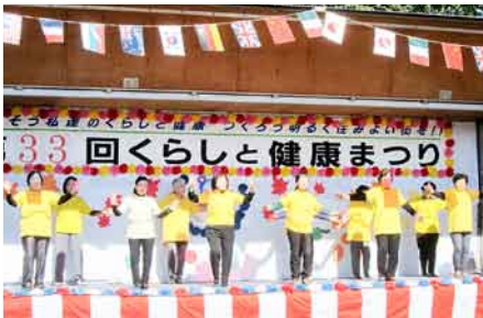
ずんどこ節 (健康班)