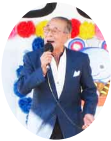
唄と踊りの馬場劇場