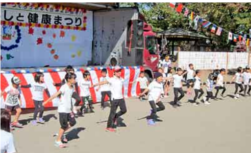
ヒップホップダンス (JVダンスネーション)