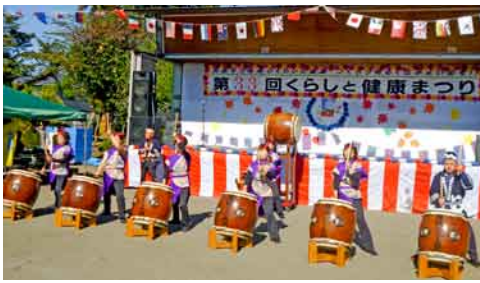
薄根ふるさと太鼓

10月18日(日)、沼田十王公園にて、毎年恒例のくらしと健康まつりが晴天のもと開かれ、約2,000人が来場しました。