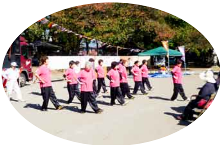
太極拳 (日中友好協会)