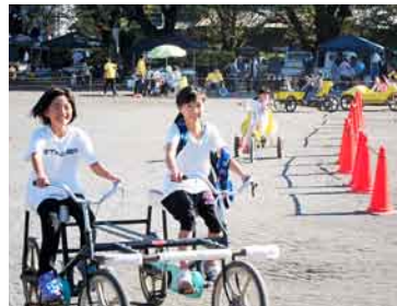
おもしろサイクル