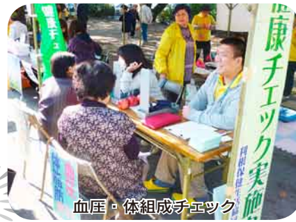
血圧・体組成チェック