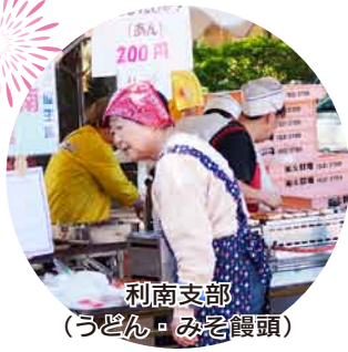
利南支部 (うどん・みそ饅頭)