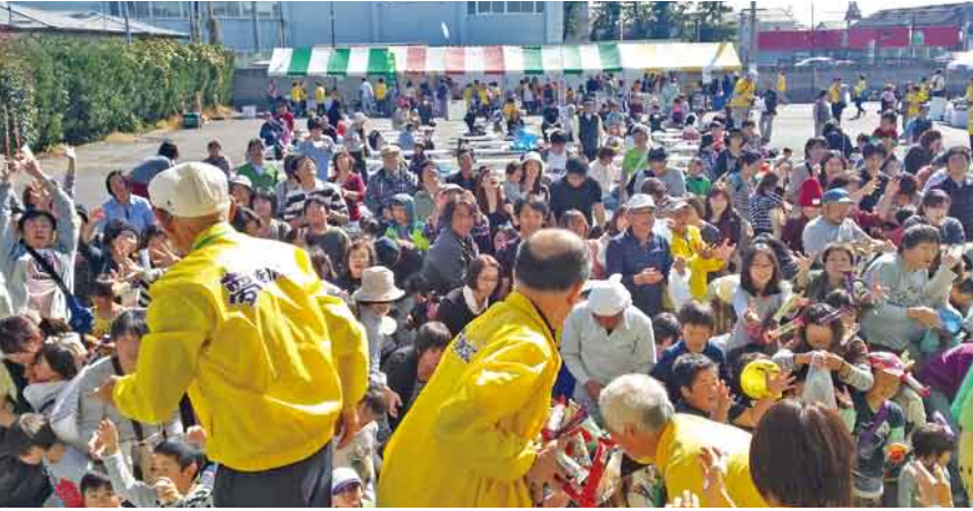
「上棟祝い」の餅投げ

10月19日(日)、利根中央病院「きらめき祭」が開催され、2,000人を超える来場がありました。 今年、「ありがとう利根中央病院・新病院上棟祝い」 2.5億円増資達成に向けた取り組み「生協60周年祝い」という目的で企画しました。 新病院上棟祝いでは、開会後餅つきをおこない会場のみなさんにふるまわれ、お昼には餅投げがされました。また、当日の「きらめき出資」に協力いただいた方、先着100人に組合員さん手作りのお赤飯が配られました。会場内での理事さんによる増資協力の声かけや事前に配布したお祝い袋の効果で2人から100万円の大口出資の協力。当日だけで532万円が寄せられました。 この「きらめき出資」は、同日開催の「くらしと健康まつり」の会場でも受け付けました。また、全職員にもお祝い袋が事前に配布され、現金や給与積立などの協力が呼びかけられました。