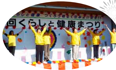
猿ヶ京・須川・新巻 (北国の春にあわせて体操)