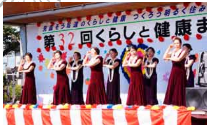
フラダンス (ブア・カラウヌ、ロゼラニ)