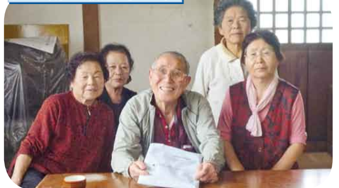
腎不全について/尿チェック(糖・蛋白・塩分) 透析生活のDVDを見ながら、予防の大切さを学びました。