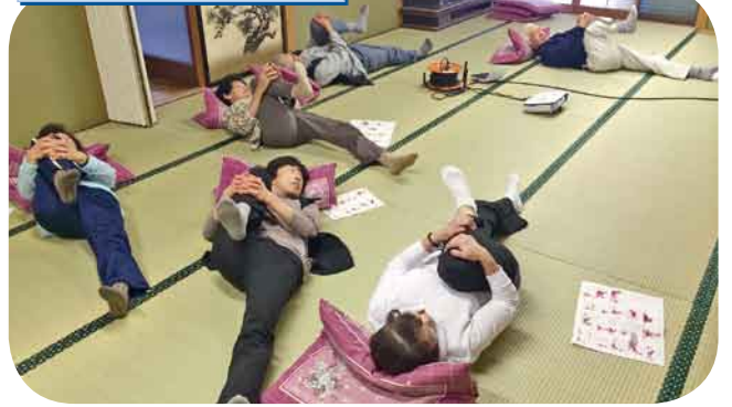
ころばん・腰痛体操 足を抱えて、ストレッチ! 腰周りの筋肉を鍛えました。