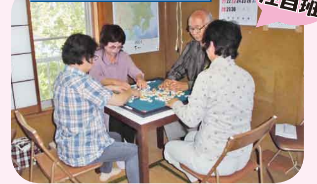
健康マージャン教室(第2・第4日曜日) 7月より上川田町のたまり場で脳の活性化に「飲酒、煙草、金銭の禁止」のマージャン教室を開催しています。川田地区以外からも、また女性や初心者も多数参加して熱い勝負に「リーチ一発」と声飛び交い大変にぎやかです。性別、年齢は不問、参加費、申込みは不要です。待ってま〜す!