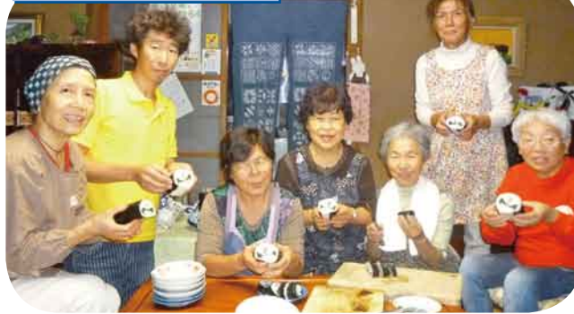
調理班会(太巻きすし作り) 調理師の指導で、花模様の太巻きが上手にできました。