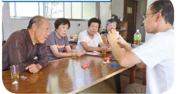
歯と口のはなし/歯槽膿漏・虫歯チェック いろいろな種類の義歯を見ながら特徴を学びました。