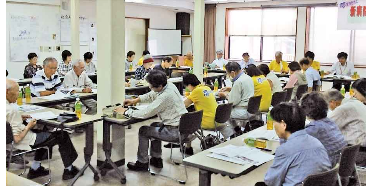
20支部の参加で議論を深めた正副支部長会議

利根保健生活協同組合 〒378-0053 沼田市東原新町1861番地1 ☎0278(22)6060 FAX(22)6262 事業所 利根中央病院 ☎(22)4321 利根歯科診療所 ☎(24)9418 介護老人保健施設とね ☎(22)8855 とね訪問看護ステーション ☎(23)3706 とねね診療所 ☎(24)1202 生協みなみ歯科 ☎(25)3399 片品診療所 ☎(58)3910 ホームページアドレス http://www.tonehoken.or.jp/tonehoken-kumiai/