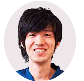
利根歯科診療所 歯科医師