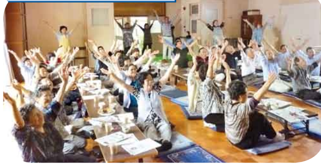
ピロリ菌について/笑いケア体操 笑いのエクササイズで心身ともにスッキリしました。