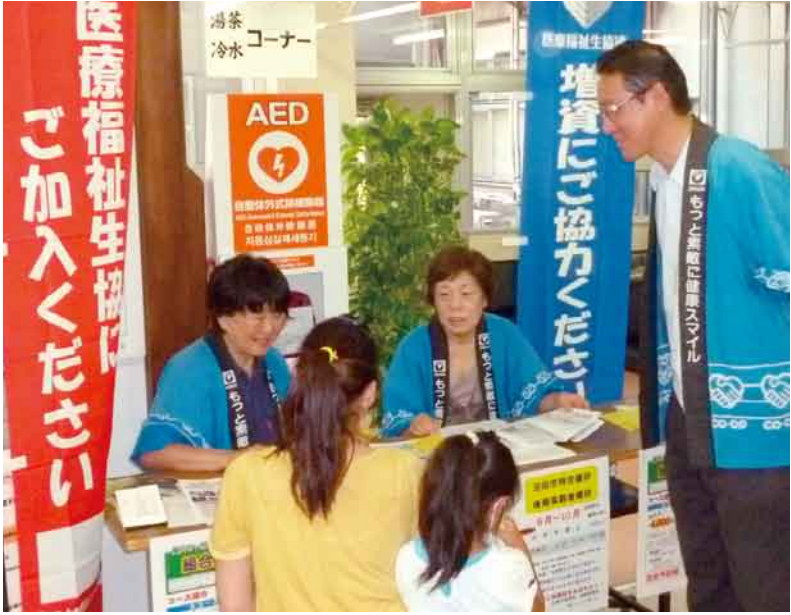
特設窓口で生協加入のおすすめ

利根保健生活協同組合 発行人 山田 忠夫 発行部数 21,600 編集 「利根の保健」編集委員会 〒378-0053 沼田市東原新町1908番地の6 ☎0278 (22) 6060 FAX (22) 6262 事業所 利根中央病院 ☎(22)4321 利根歯科診療所 ☎(24)9418 老人保健施設とね ☎(22)8855 とね訪問看護ステーション ☎(23)3706 生協みなかみ歯科 ☎(25)3399 片品診療所 ☎(58)3910