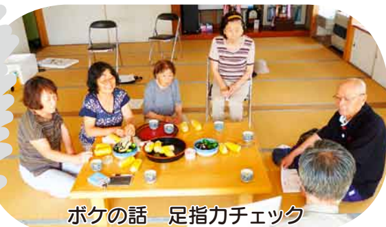
ボケの話 足指力チェック ボケの話は大変好評でした。