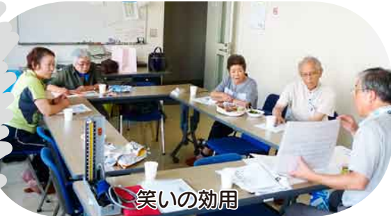
笑いの効用 6年ぶりに班会を開き「健康手帳がいっぱいになるくらい班会をしていこう」と。