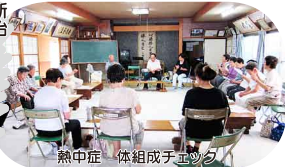
熱中症 体組成チェック 「内臓脂肪はどうすれば減るかな」質問あり、検査結果について学習しました。