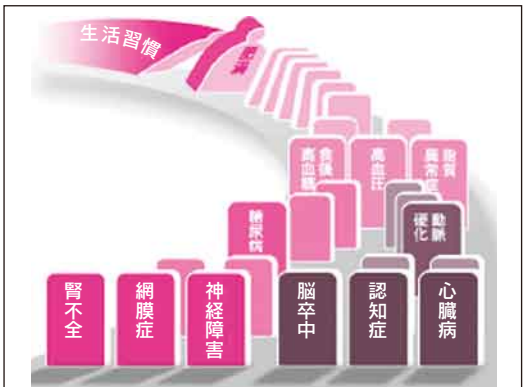
メタボリックドミノのイメージ

メタボリックシンドロームは互いに関連しており、発生に至る過程の解明が進んでいます。これを捉えたのが「メタボリックドミノ」という考え方です。肥満から高血圧、