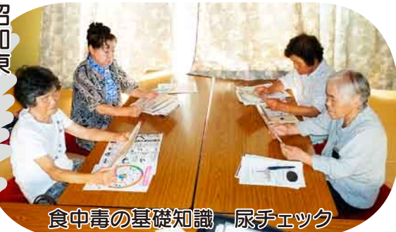
食中毒の基礎知識 尿チェック この時期にぴったりの内容で、家での注意点を学びました。