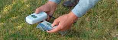
放射線モニタで線量測定を行う組合員 組合員を対象に、放射線モニタの無料貸出も行ってあります(予約制)。貸出に関するお問い合わせは利根保健生協組織部 ☎0278-22-2300 まで。

して風が吹いた時など、再度空気中に舞い上がることもあります。これらに関しては、「新たな放出がない事」を前提に、放射性物質の濃度の高い場所を見つけて出し、適切に処理することが重要です。