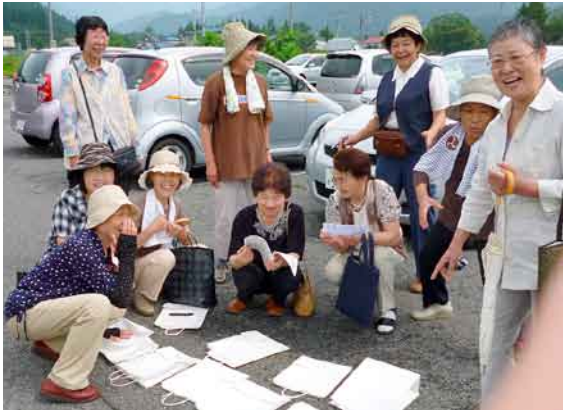
訪問前のうちあわせ (新治支部)

地域訪問活動 対話の“輪”ひろがる 新病院建設への進捗状況を多くの組合員に伝えること、組合員の要望や意見を受けとめ、地域住民と職員が一丸となつて建設運動につなげることを目的に、地域訪問のとりくみがされています。 沼田中・沼田北・水上などの支部では、連携職場と協力して「利根の保健」が届いていない地域の訪問を予定し、新病院建設の進捗状況を、はじめ、組合員健診や通院支援などのお知らせをしています。 新病院建設に期待し増資をしていただいた方、「頑張ってください」「通院支援で助かっている」など声をかけてくれる方