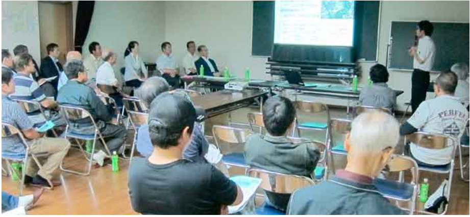
地元地域で住民説明会 (▲沼須町 ▼新町)

利根保健生活協同組合 発行人 山田 忠夫 発行部数 21,400 編集 「利根の保健」編集委員会 〒378-0053 沼田市東原新町1908番地の6 ☎0278 (22) 6060 FAX (22) 6262 事業所 利根中央病院 ☎(22)4321 利根歯科診療所 ☎(24)9418 老人保健施設とね ☎(22)8855 とね訪問看護ステーション ☎(23)3706 生協みなみ歯科 ☎(25)3399 片品村鎌田 片品診療所 ☎(58)3910