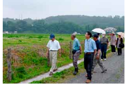
建設地を歩いて一周 (月夜野東支部)

第36回通常総代会で確認された新病院建設地の「沼須産業団地」が、正式に利根保健生協の所有地になりました。 7月10日、県企業局管理者より、『売渡決定通知書』が理事長あてに届けられ、7月24日には、県企業局と契約書を締結しました。いよいよ念願の新病院建設に向けて、具体的検討と様々な課題の解決をすすめていきます。 このように、現地での説明会が開かれました。