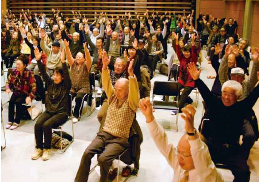
レインボー健康体操を笑顔で楽しむ参加者たち

利根保健生活協同組合 発行人 山田 忠夫 発行部数 21,400 編集 「利根の保健」編集委員会 〒378-0053 沼田市東原新町1908番地の6 ☎0278 (22) 6060 FAX (22) 6262 事業所 利根中央病院 ☎(22)4321 利根歯科診療所 ☎(24)9418 老人保健施設とね ☎(22)8855 とね訪問看護ステーション ☎(23)3706 生協みなみ歯科 ☎(25)3399 片品村鍼田片品診療所 ☎(58)3910