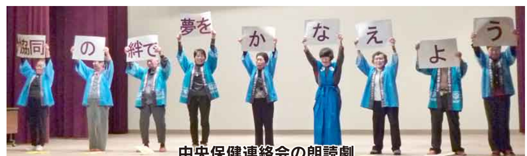
中央保健連絡会の朗読劇

「運動になり、地域のつながりづくりにもなるから『利根の保健』を配布している」 「班会を生協活動の原点として開いている」「機関紙配布や班会が増資につながる」 「事前に増資訪問日を連絡したら全家庭で協力が得られた」等の話題に共感の聲がひびきました。 また「細やかな送迎に感謝している。要望を伝えて実現できるのが生協の良いところ」と発言があり、多くの組合員が地域に生協があることのすばらしさを改めて確認する機会になりました。