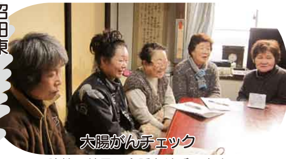
大腸がんチェック