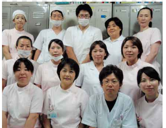
栄養課スタッフは21人 業務上全員が揃うのは難しい

私が栄養課を訪れたのは、暑い盛りの12時半、食中毒は絶対に出してはならないと床掃除に懸命でした。栄養課の仕事は、患者さんの食事の提供と栄養指導、2つである。食事作りは適切なカロリー、塩分、予算枠など厳しい制限の中でどうしたら喜ばれるかチームで奮闘している。そのため病室を回って「今日の食事はどうでしたか」と感想を聞いて歩く。また、患者さんの病気、衛生、調理方法の勉強会が行われ