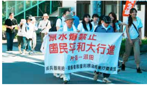
網の目品コース 村長・議長の激励を受け出発

2011年原水爆禁止平和大行進が、「網の目」「メインコース」で行われました。7月10日の「網の目」は、