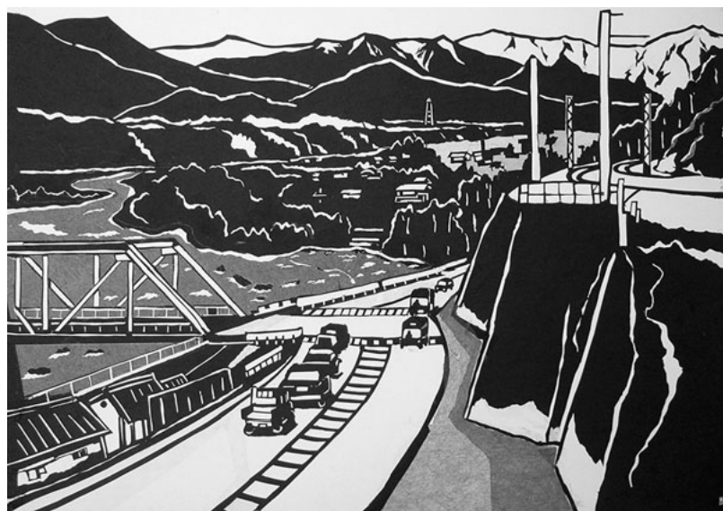
切り絵「月夜野橋付近の交通」 沼田市東原新町 児玉洋明