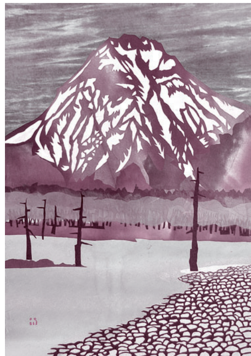
切り絵「上高地焼岳」 沼田市西原新町 加藤達男