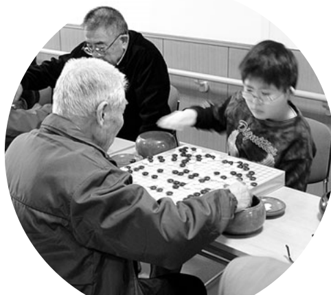
小学生を含め63人で第23回囲碁大会