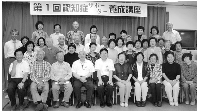
認知症サポーター養成講座 2回開催しサポーター65人誕生