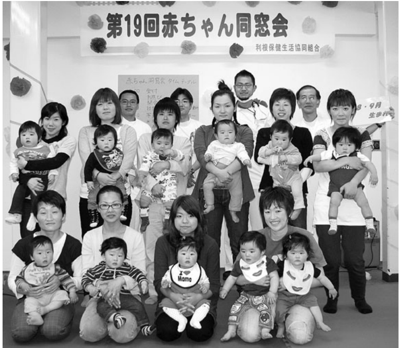
年2回開催の「赤ちゃん同窓会」