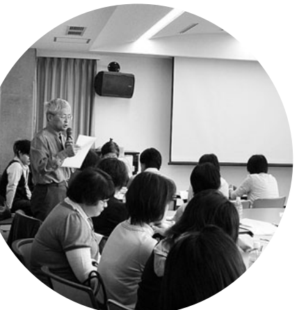
看護師増やして安心・安全な良い医療を県民医連看護師集会