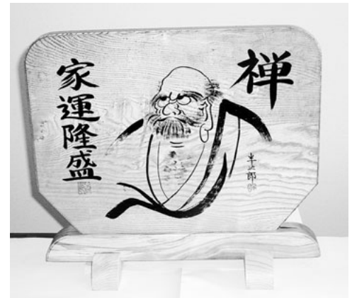
沼田市鍛冶町 馬場 半次郎