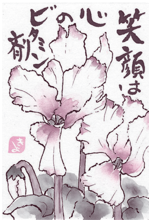
絵手紙 みなかみ町月夜野 山田清子