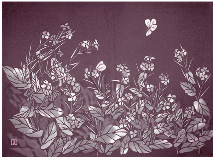
切り絵「紫花葉」 沼田市鍛冶町 北爪とり