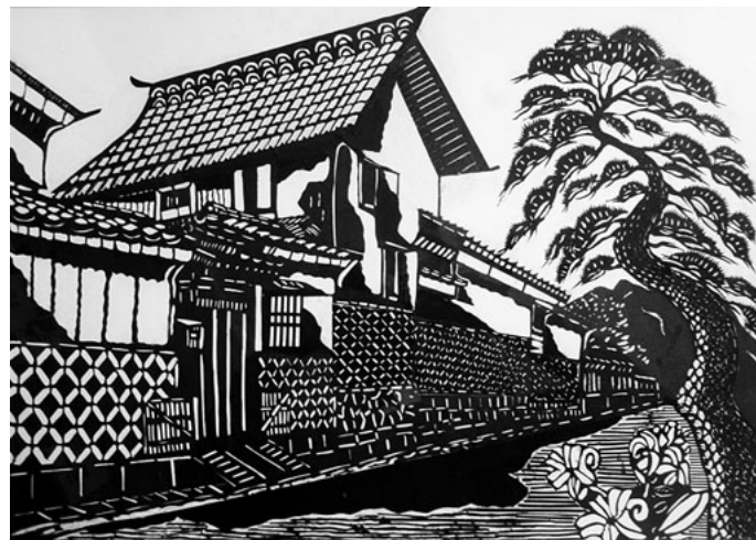
切り絵「飛騨高山の蔵づくり」 沼田市白岩町 丸山 久