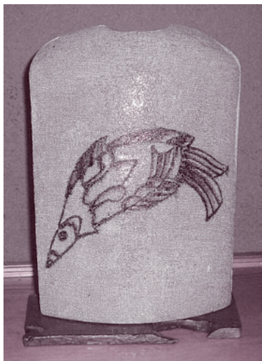
陶芸 沼田市材木町 岡田誠