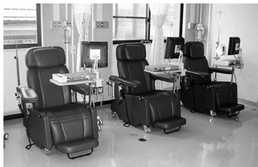
「通院で患者負担軽減」外来化学療法室開設 10月

「生活習慣病」は突然起こるものではありません。食習慣 運動不足 ストレス 喫煙 飲酒など、その積み重ねが原因です。