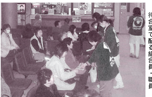
待合室で配る組合員・職員

バレンタインデーの2月14日、全国の医療生協は「虹のバレンタイン」行動を取り組みました。「医療や介護保険」「憲法9条」など、医療生協の考えを地域に広げ、住民の「声」を国などに届ける取り組みです。利根保健生協ではチョコレット付のはがき1200組を配布しました。500組を準備した利根中央病院外来の行動には、生協のハッピを着た18人の組合員が参加しました。