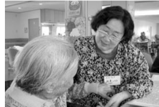
聴くことによって相手の心を癒す『傾聴』も大事なボランティアです。

あなたのお力を貸して下さい 老健とね ボランティアさん募集 施設利用者様との談話やお茶出しなど日常的に関われる方や、施設行事のお花見会・餅つき大会などに協力いただけるボランティアさんを幅広く募集しております。 温かい気持ちで寄り添ってくださるボランティアさんの存在は、とても心強くありがたい存在です。 週に一度「二日一時間」