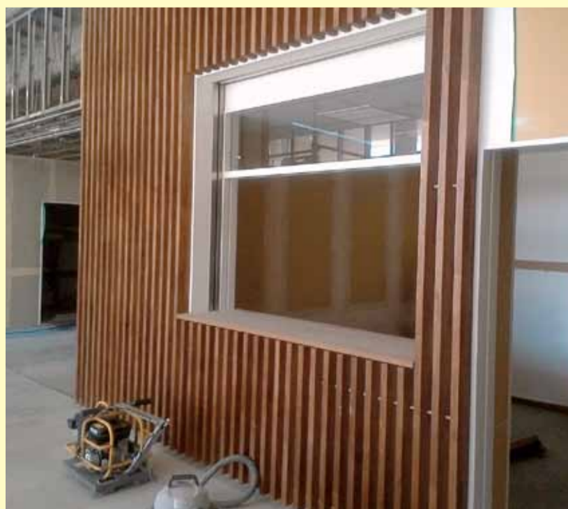
▲正面玄関を入り、すぐ右手には出資金・通院支援の窓口が設置され、生協に関する相談なども可能となります。