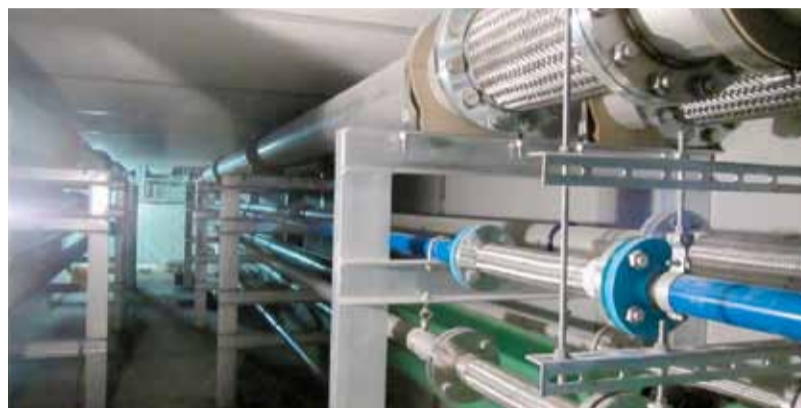
◀共同溝（配管主管） 病院棟、機械棟を地下で結ぶ各種配管

また、熱源機械棟内では、熱源設備工事を進めています。熱源工事は病院内の心臓部でさまざまな機械と配管も太く危険な作業を伴いますが、メインの配管は事前にプレハブ（工場制作）化されたものを接続していくため、現場での作業効率も上がり短い工事期間の短縮化を図っています。