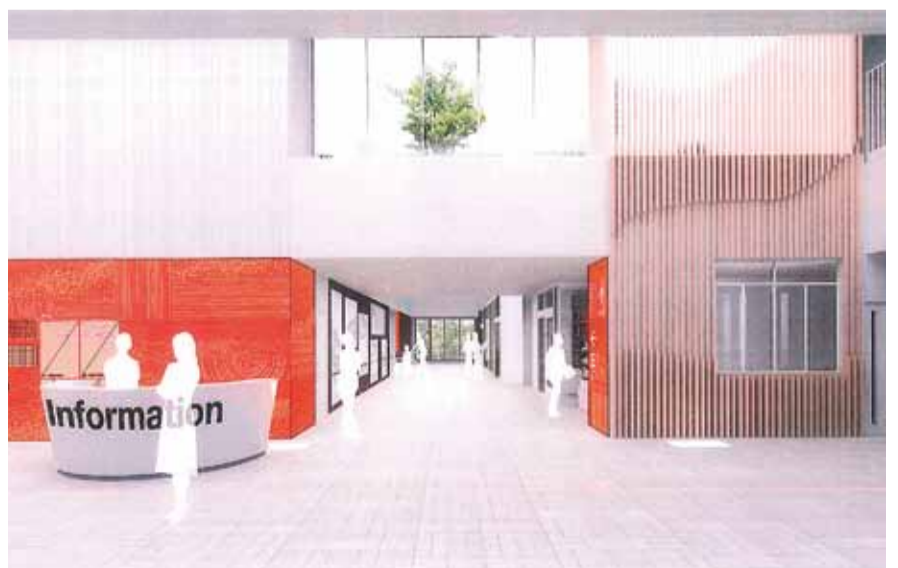
▲ エントランスのイメージ