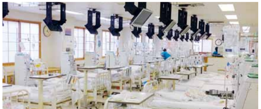
◀ 現病院での透析室

総合病院という性格上、通常の透析だけでなく、細菌が体内に入り血圧が下がった際に行なうエンドトキシン吸着療法、クローン病や潰瘍性大腸炎に対して行う白血球除去療法(LCAP)を行ったり、近隣の透析病院で合併病を生じ入院加療が必要となった方の受け入れなども行っております。