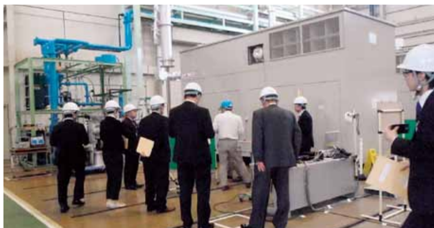
▲工場検査（ガスコージェネレーション） ヤンマー岡山工場にて性能試験を実施

また、作業員の中には沼田市周辺の業者にもご協力いただき、このような計画を効率的に使用していただくため現場職員と作業員が一致団結して施工しております。