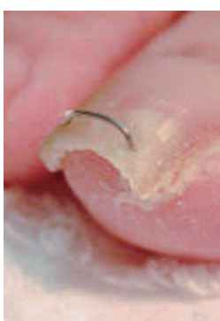
図4 ワイヤー挿入により爪を開く方法

形状記憶のワイヤーを爪に装着し、彎曲した爪を持ち上げることで痛みをとります。彎曲の強い巻き爪で、爪がある程度のびている方には行なえます(図4)。