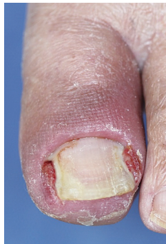
図1 深爪の喰い込みみによる肉芽ができてしまった陥入爪

「陥入爪」は爪自体の変形は少ないものの爪の側縁だけ少し曲がっていたり、深爪してしまっその先端が皮膚に喰い込んでし