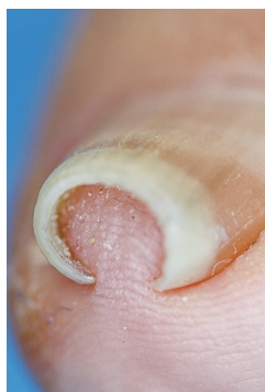
図2 爪が彎曲してしまっ高度の巻き爪

のができてしまうこともありま す(図1)。 これを「肉芽(にくげ)」とい いますが、肉芽ができる、さ らに爪を圧迫するので痛みが強 くなってしまう。