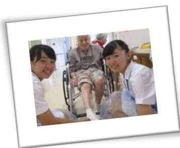
看護体験：足浴しながらパチリ