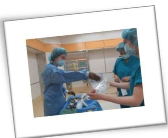
手術室：手術の見学や患者体験