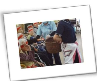
老健の運動会：玉入れ奮闘中

看護師・助産師奨学金制度もあります。お気軽にご相談下さい。問い合わせ先：利根中央病院看護部長室